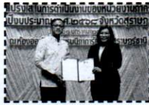
กิจกรรม : มอบประกาศเกียรติคุณการประเมินคุณธรรมและความโปร่งใส ปีงบประมาณ 2567