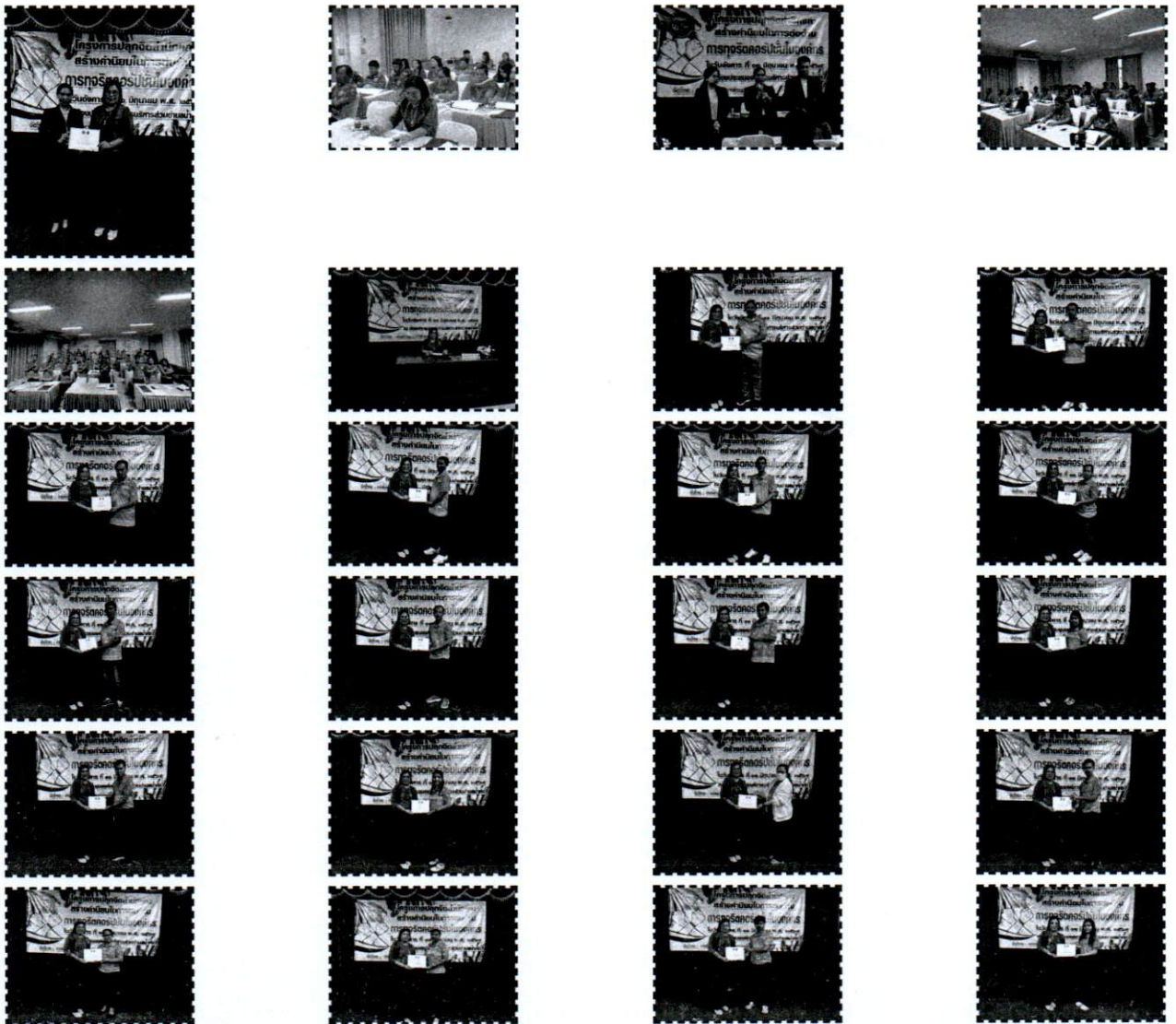
กิจกรรม : โครงการปลูกจิตสำนึกและสร้างฝักร่วมใจในการต่อต้านการทุจริตคอร์ปชั่นในองค์กร 2567