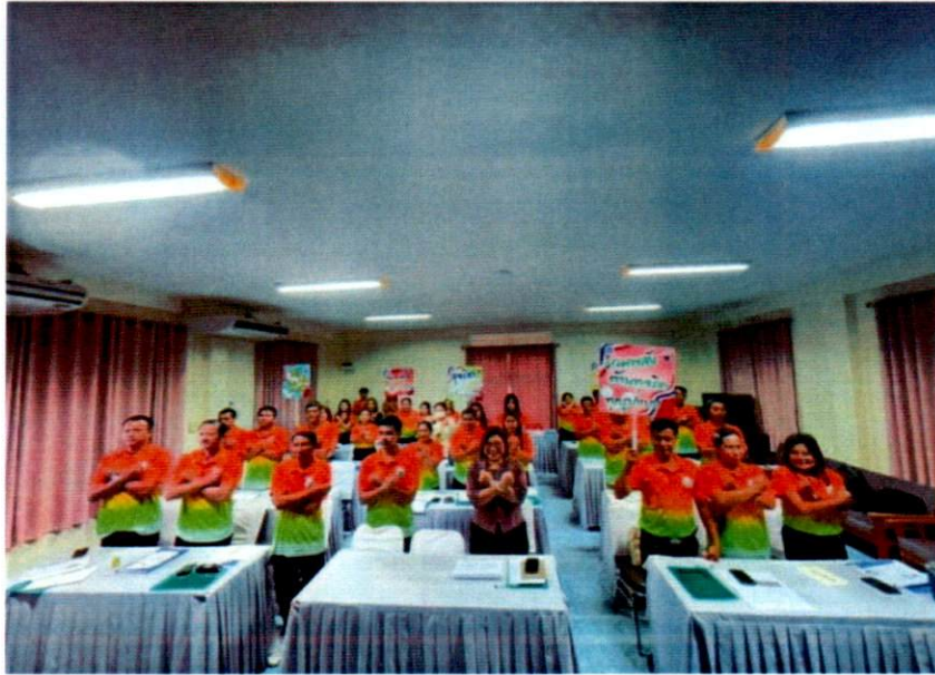
เจ้าหน้าที่บรรยายหัวข้อปลูกจิตสำนึกและสร้างค่านิยมในการต่อต้านการทุจริตคอร์รัปชันในองค์กร

โครงการปลูกจิตสำนึกและสร้างค่านิยมในการต่อต้านการทุจริตคอร์รัปชันในองค์กร องค์การบริหารส่วนตำบลน้ำหัก